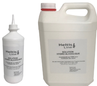
316HGH300 Flacon 1 L